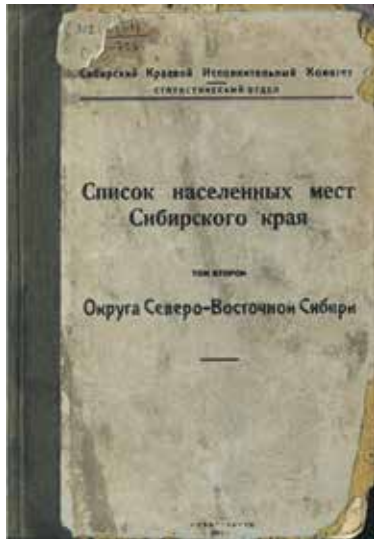
Обложка 2-го тома «Списка населенных мест Сибирского края», изданного в 1929 году в Новосибирске.

До этого дата основания Болотного не упоминалась ни в одном известном источнике вовсе. Ее не было в «Списках населенных мест Томской губернии» и в «Памятных книжках Томской губернии», в исторических очерках губернских журналов и газет XIX — начала XX веков, о ней не сообщалось в начале 1920-х годов на страницах болотнинской газеты «Пролетарская мысль».